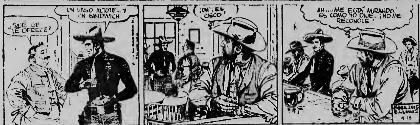
Cisco a drento e salon di baile y a dicidi di tira algo na stoma. F walter a bin contré masha servicial y ta puntré: Di qui mi por sirbibo? Un doppel y un sandwich, e ta contesta. Y tur es ora cu nan dos ta papando, futo cu ta tumando su trago, a bira wela...